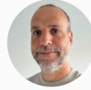
Markus Büchel Stiftung SOVORT Liechtenstein Offene Jugendarbeit und Streetwork