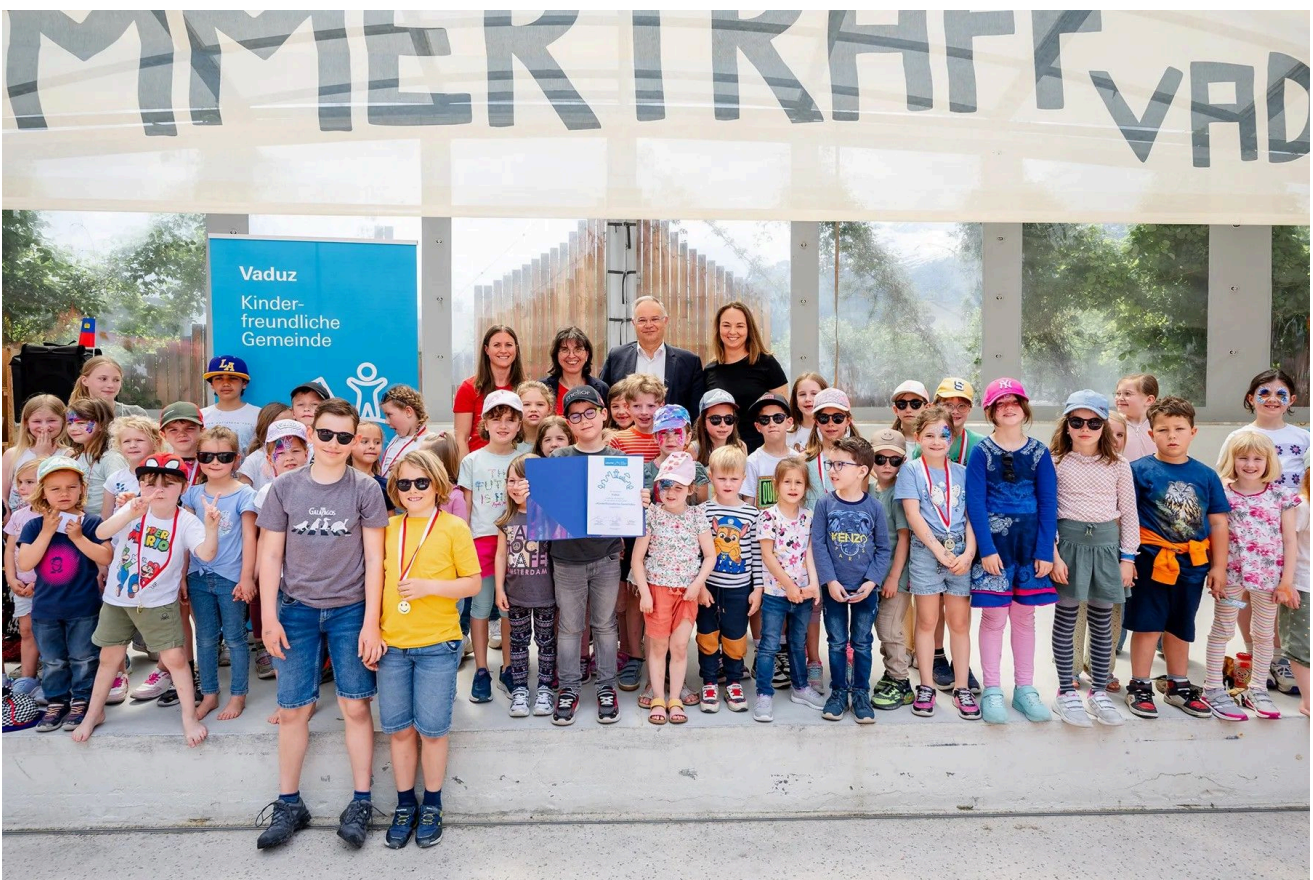
Vaduz und Triesen erhielten neu das UNICEF-Label „kinderfreundliche Gemeinde“. Die OSKJ ist Mitglied in der Fachkommission für die Zertifizierung.

das UNO-Kinderhilfswerk UNICEF an Schweizer und Liechtensteiner Gemeinden vergibt. Dafür müssen sich die Gemeinden einer umfassenden Prüfung unterziehen: es werden z.B. sichere Spiel- und Kontakträume, Mitbestimmungsmöglichkeiten und kinderfreundliche Angebote analysiert. Und es wird beurteilt, wie die Gemeinden die Rechte von Kindern und Jugendlichen weiterentwickeln. Die OSKJ ist Mitglied der UNICEF-Fachkommission und beurteilt die liechtensteinischen Gemeinden mit. 2024 wurden die Gemeinden Vaduz und Triesen erstmals zur „kinderfreundlichen Gemeinde“ gekürt. Eschen - seit 2018 „kinderfreundliche Gemeinde“ - wurde erneut zertifiziert. Herzliche Gratulation an diese drei Gemeinden und an die weiteren drei bereits mit dem Label versehenen Gemeinden Ruggell, Mauren und Schaan für ihre kinderfreundlichen Bestrebungen!