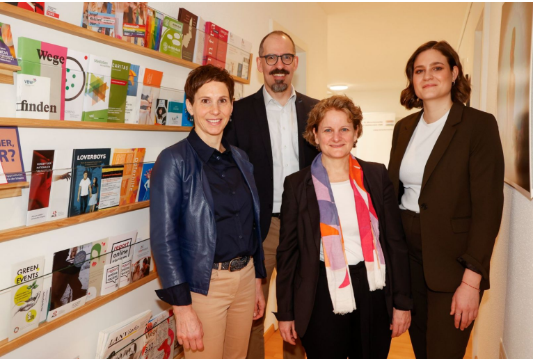
Der Vorstand und die Geschäftsstelle des Vereins für Menschenrechte