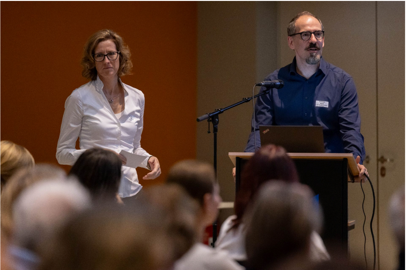
Das Projekt „politische Partizipation“ wurde vom VMR und Vielfalt in der Politik am Integrationsdialog der Regierung vorgestellt. Ausländerinnen und Ausländer wünschen sich mehr Mitsprache und Mitbestimmung.