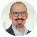
Christian Blank Verein für Menschenrechte