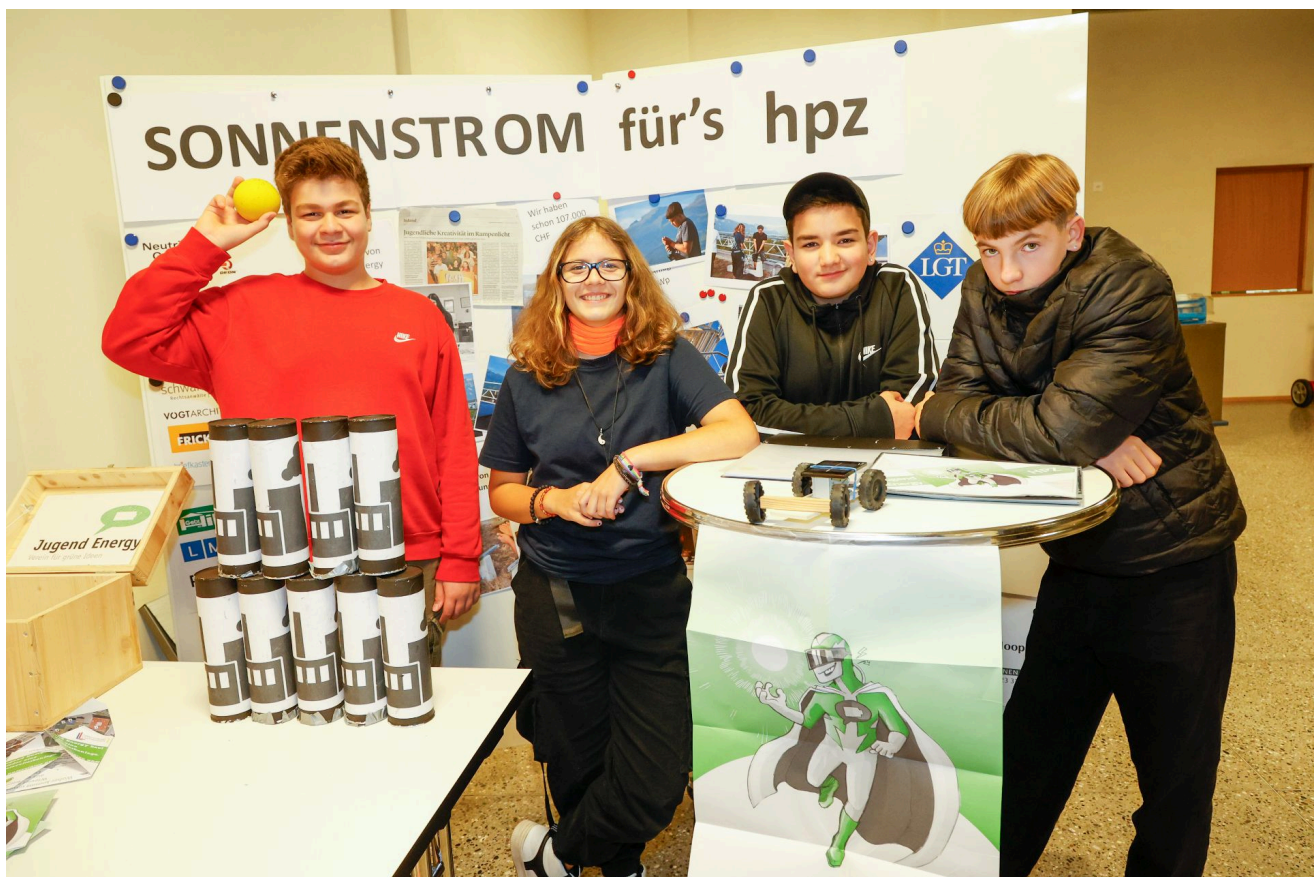
Die Kinderlobby unter der Koordination der OSKJ setzte sich im zweiten Kampagnen-Jahr von „Zemma Handla“ weiter für Umwelt und Nachhaltigkeit ein und zeigte die Vielfalt der umgesetzten Projekte, zum Beispiel am Tag der Kinderrechte.

Die zweijährige Kinderlobby-Kampagne „Zemma Handla“ ging 2024 zu Ende. Kinder und Jugendliche thematisierten zusammen mit verschiedenen Partnerorganisationen auf vielfältige Weise ihr Recht auf eine saubere und sichere Umwelt, vermehrten ihr Wissen und sensibilisierten ihr Umfeld und die Gesellschaft.