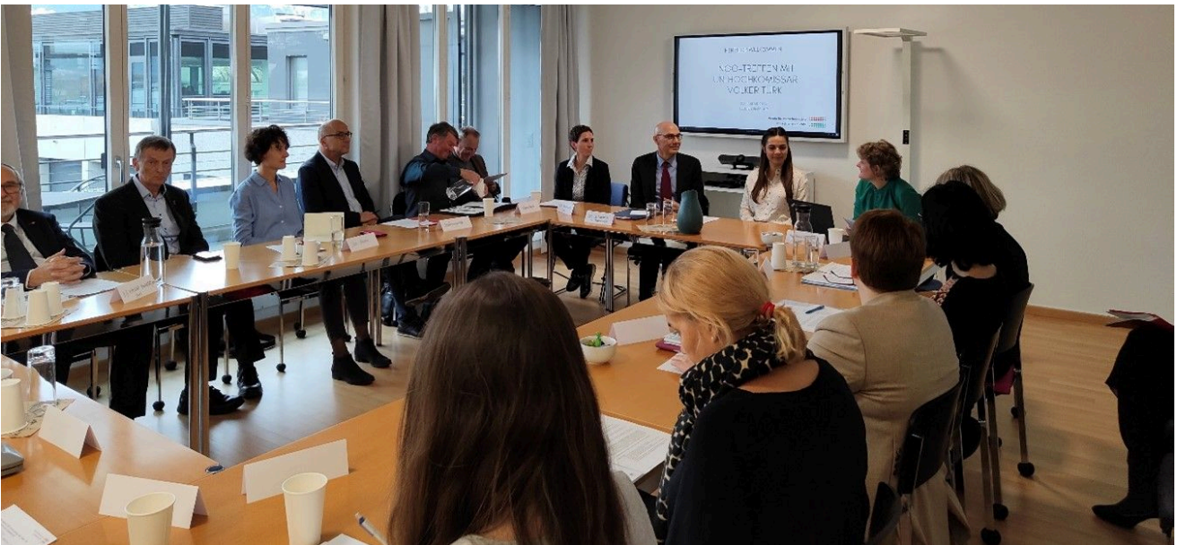
Der Besuch des Hochkommissars für Menschenrechte, Volker Türk, war ein Highlight. Er ermutigte alle Nichtregierungs-Organisationen, sich weiterhin für die Rechte verletzlicher Gruppen stark zu machen.

Am 22. Januar besuchte der UNO-Hochkommissar für Menschenrechte, Volker Türk, Liechtenstein. Eine seltene Gelegenheit, mit dem globalen Beschützer der Menschenrechte diskutieren zu können. Bei den Treffen, das vom VMR organisiert wurde, sprach der Hochkommissar mit 16 Nichtregierungs-Organisationen über die aktuellen Herausforderungen im Bereich Menschenrechte. Er betonte, wie wichtig Menschenrechte, Demokratie und Rechtsstaatlichkeit für unsere Freiheit und Gleichheit sind. Er rief alle Organisationen dazu auf, ihre wichtige Arbeit weiter voranzutreiben und sie sichtbar zu machen. Dieser offene und inspirierende Austausch hat alle Beteiligten motiviert, weiterhin für wichtige Anliegen einzustehen und gemeinsam Lösungen zu finden. Es zeigt, wie viel wir erreichen können, wenn wir zusammenarbeiten!